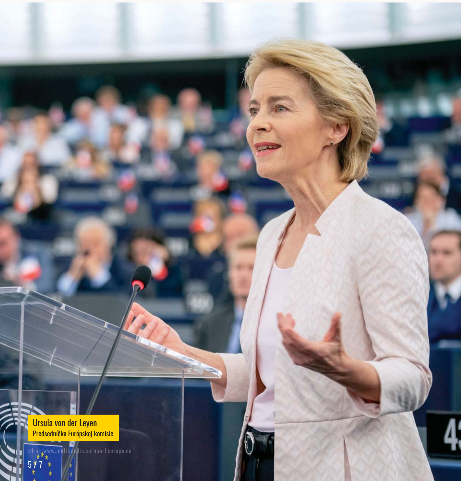
Ursula von der Leyen Predsedníčka Európskej komisie

Kvalifikovaná väčšina je dôležitým prvkom pri integrácii v rámci EÚ a pri vykonávaní rôznych politík na európskej úrovni. Tento systém zabezpečuje, že väčšina štátov vie zabrániť spomaleniu integrácie zo strany menšieho počtu štátov. Nástrojom na takéto blokovanie rozvoja je napríklad princíp „veta“, ktorý pri hlasovaní kvalifikovanou väčšinou nie je možné uplatniť.